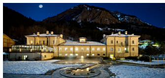
QC TERME Pre Saint Didier